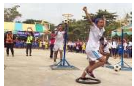
チアシム小学校の様子