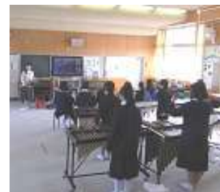
スカイプで音楽演奏

カンボジアから受入：教育省担当官が、岡山大学と岡山・倉敷の小・中学・高校で研修を行った。