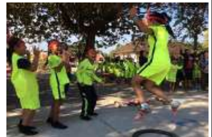
ワットリエブ小学校の様子