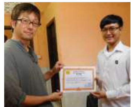
初級修了証書授与