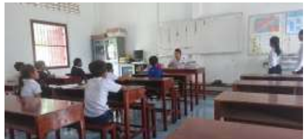
チェイ小学校 HG 日本語教室