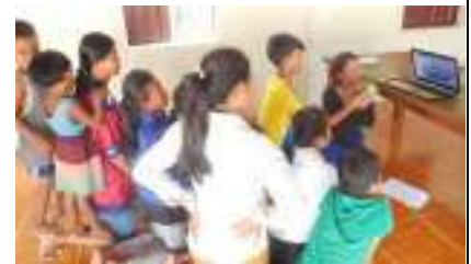
スカイプで日本の学校と交流

2017年4月から2018年1月までの10か月間、広島大学の学生1名がインターンとしてシェムリアップの活動(NCCC&日本語教育)に参加した。