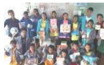
生活用品を支援してもらいました

支援物資は、T シャツ、教材、文房具、歯ブラシ、カレンダー、石鹸、衣類、タオル、遊具、生活用品などを持ち込み、小学校や施設他に配付した。