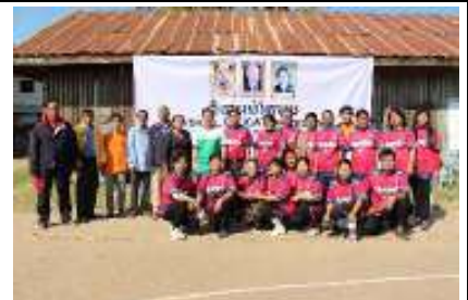
ミタピアップ小学校の運動会後の全体写真